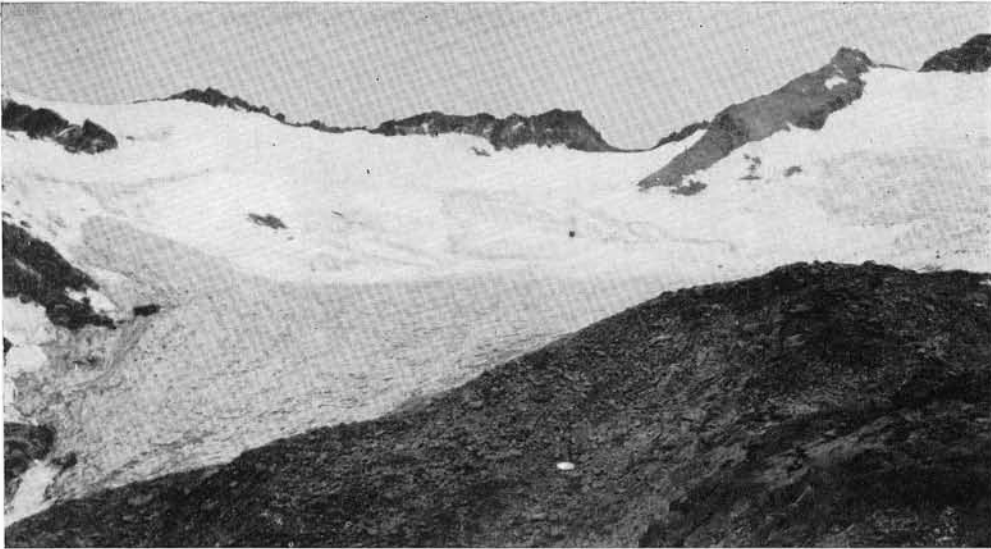
Il ghiacciaio occidentale di Presena da NNE, da stazione fotografica a q. 2578.

Si stende su un piano ondulato e delimitato ad O ed a S dalla cresta Passo di Casamadre - Punta di Lago Scuro - Cima Presena (3068) e ad E da una sella che alcuni decenni fa permetteva una trasfluenza verso l'omonimo ghiacciaio orientale. La fronte termina appiattita in una piccola conca.